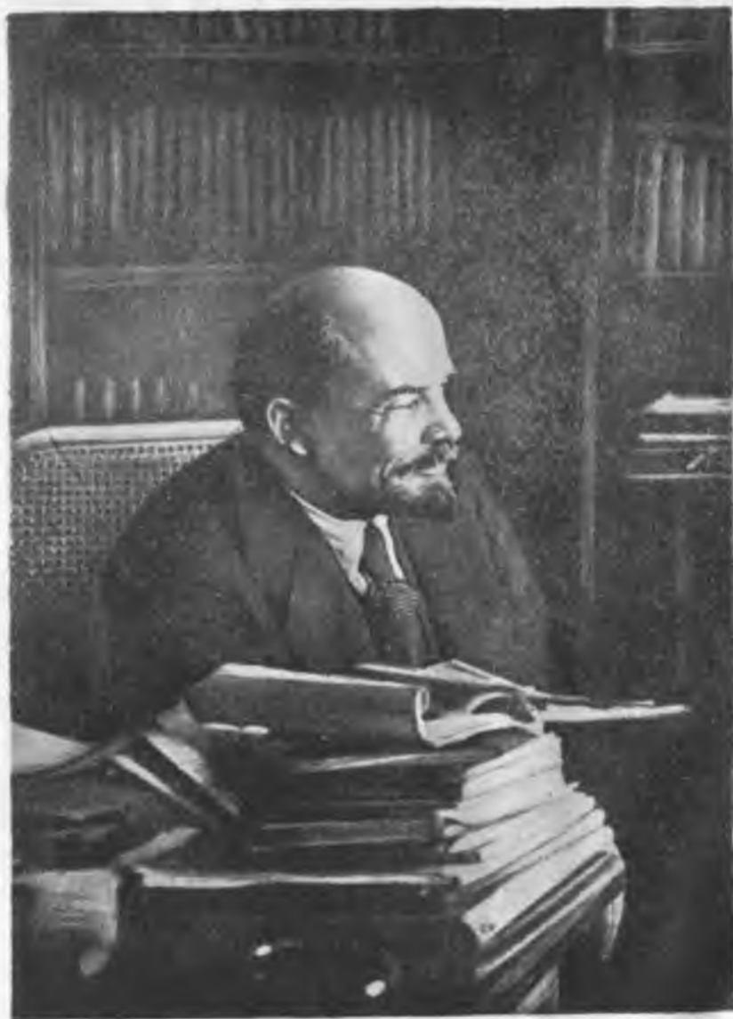
В. И. Ленин 1921 джылда.