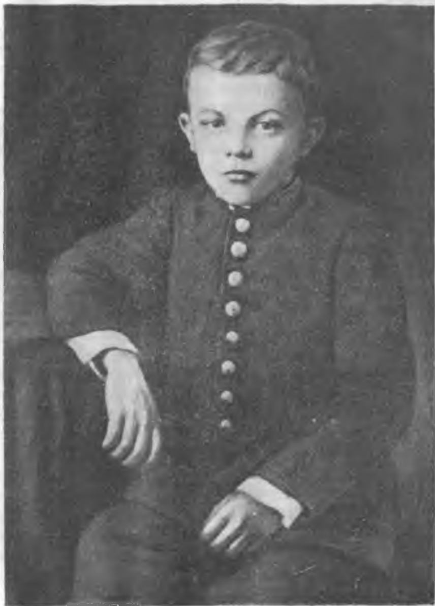
В. И. Ленин—1-чи классны гимназисти. 1879.