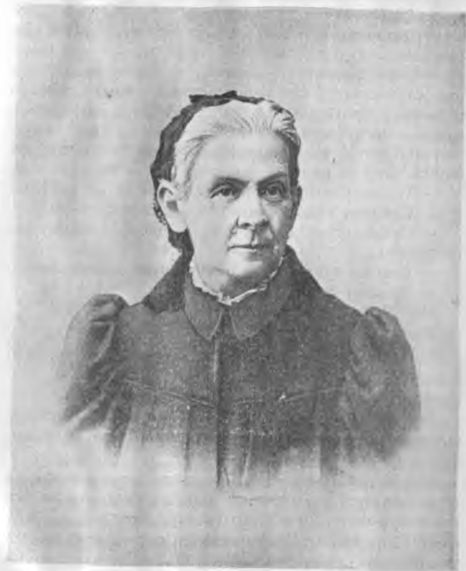
Мария Александровна Ульянова, В. И. Ленинни анасы.