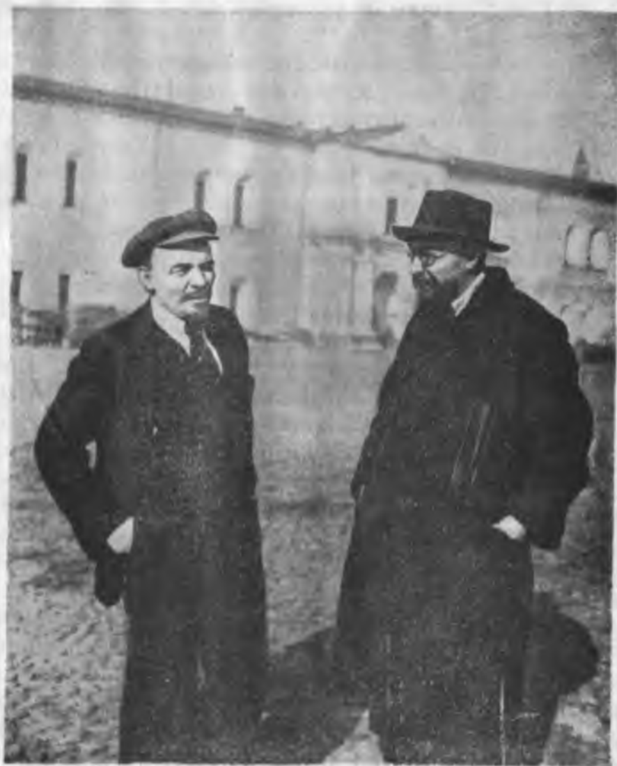
В. И. Ленин бла В. Д. Бонч-Бруевиччи Кремлде айланыулары.