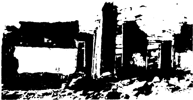
Схауат элде мекамла.

ушагъан ма бу уллу (этажлы) эски мекамладан сора джукъ къалмагъан эди, башхасы олуб эди.