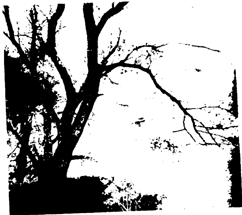
Сын Терек.

Чунгурну къазсам, анамы табарыкъ болур эдим, дегенлей бюгюнюме джетдим. Инчиклерине джетген чачы бар эди. Чач дженгил чириб къалмайды да. Чачы бла сюеклерин табарыкъ эдим, деб акъылым алайды. Атам Азиядан бери бир да бек