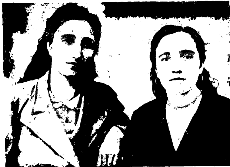
Деккушланы Зурум тенг къызы бла. 1943 джыл.

Мен, анамы инджиллигин билиб, къан дыгалас этиб кюрешдим, «барыгъыз да анда боллукъсуз» деген болмаса, иерге унамадыла. Аланы «андалары» джаханим кѣре эдим. Тохтай-тохтай, джыйырма бла юч кюнню барыб, посздибиз Фрунзеге алай джетген эди. Фрунзеде тюшдюк. Хамамгъа кирликсиз, дедиле да, бардыкъ. Хамамгъа кириб, кийимми ауушдурлукъса! Бит да болуб, къурт да болуб, алай джыйылгъанбыз. Не келсин, сапынынг джокъ, тарагъынг джокъ. Джылы суудан сора ала не сапын, не башха джукъ кѣргюзтмедиле. Дженгил, дженгил деб, хар кимни ашыкъдырыб. Хар кимни аягъы-башы — сууукъ, юсю — джалан. Джылы сууда джууунган атлы этиб чыкъдыкъ, бир аман печни къатында, салам отда чачыбызны кебдирирге кюрешдик. Меѳи уа бир узун чачым бар эди. Энди джугъу да къалмагъанды. Ма алай юсюбюз, чачыбыз да кебмегенлей чыгъабыз, эшикде уа къар джаууб тура эди. Элтедиле да бир