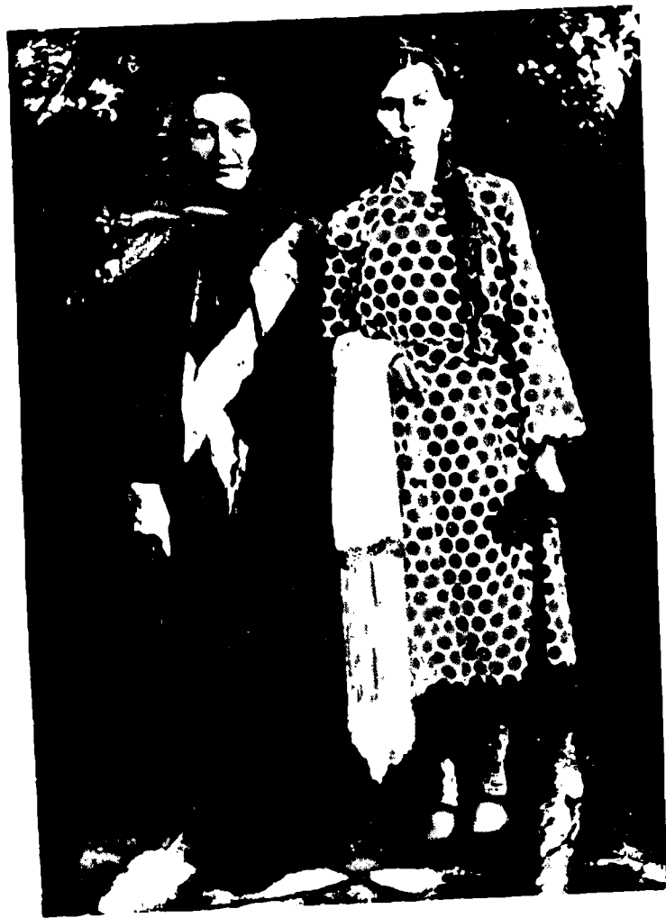
Элкыанланы Супият гитче эгечи бла.