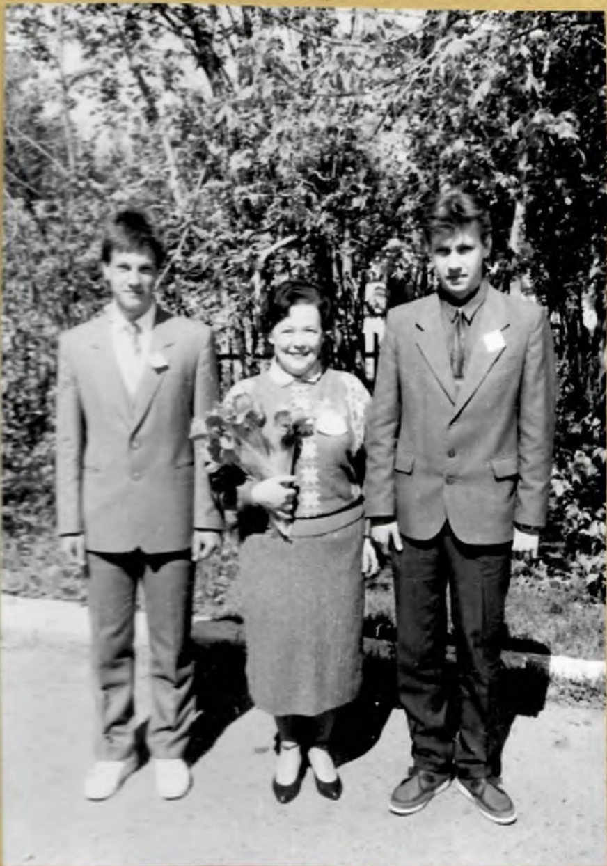
25 мая 1989 года