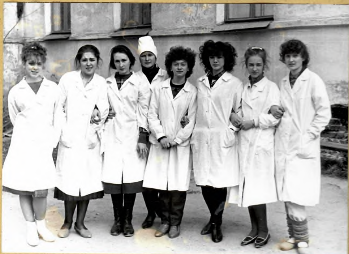
10 е класс на практике в ЦРБ; 6 мая 1989 г.