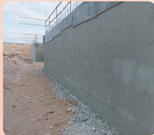
3023 Изолатекс, 3024 Изолатекс Plus, 3025 Ультраластик: гидроизоляция наружных стен подвалов, паркингов