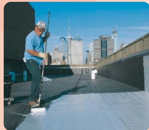
3027 Изолатекс UV, 3131 Эластикор, 3151 Эластикул: гидроизоляция кровли