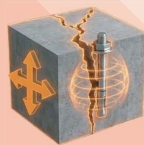
Зона С2 - критические сейсмические нагрузки