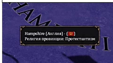
РИСУНОК №6. ПРИМЕР ДАННЫХ О РЕЛИГИИ