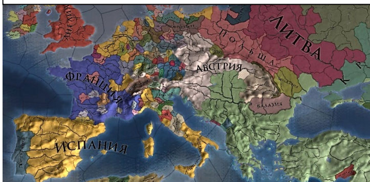
РИСУНОК №4. ПРИМЕРЫ КРУПНЫХ ДЕРЖАВ НА ПОЛИТИЧЕСКОЙ КАРТЕ МИРА

Пример подобного действия представлен на рисунке №3.