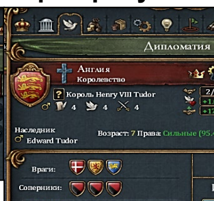
ИНФОРМАЦИЯ О ВОЙНАХ И СОЮЗАХ