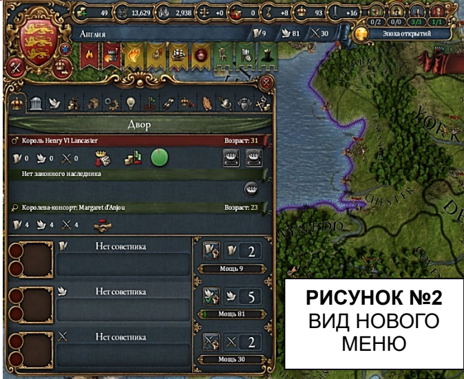
РИСУНОК №2 ВИД НОВОГО МЕНЮ