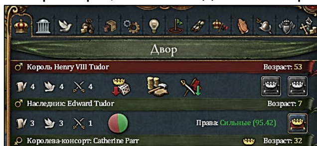
ИНФОРМАЦИЯ О ПРАВИТЕЛЕ СТРАНЫ