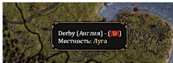
РИСУНОК №3. ПРИМЕР ОПИСАНИЯ МЕСТНОСТИ НА ФИЗИЧЕСКОЙ КАРТЕ

Пример подобного действия представлен на рисунке №3.