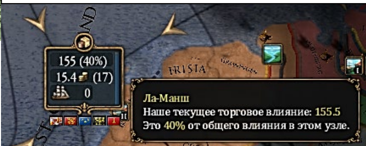
РИСУНОК №5. ПРИМЕР ДАННЫХ ИЗ СПЕЦИАЛЬНОГО ТОРГОВОГО ОКОШКА