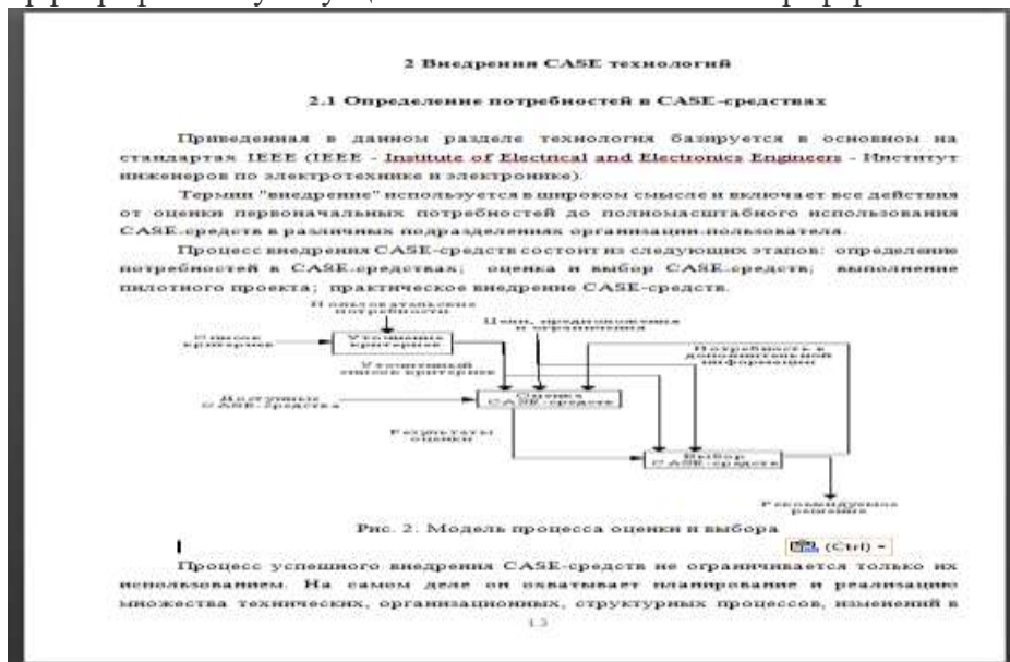
Рисунок 3. - Основная часть реферата.

Главы по объему должны быть равнозначными или разница 1-3 страницы, не более. Весь текст реферата Вам нужно перечитать и устранить все ошибки форматирования. После чего проверить орфографию и пунктуацию. Объем основной части реферата от 10-16 страниц.