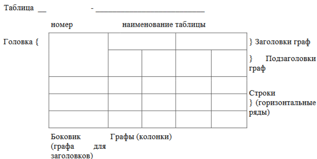
Рисунок 2 – Макет таблицы

После таблицы должно быть оставлено не менее одной свободной строки.