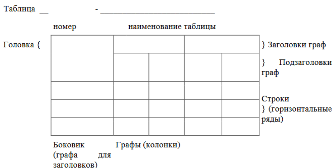
Рисунок 2 – Макет таблицы

После таблицы должно быть оставлено не менее одной свободной строки.