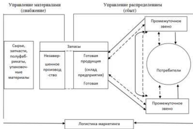
Рисунок 1 – Принципы логистической системы Рисунок 1 – Пример оформления рисунка

через тире наименование помещают после пояснительных данных и располагают в центре под рисунком без точки в конце (рис.1).