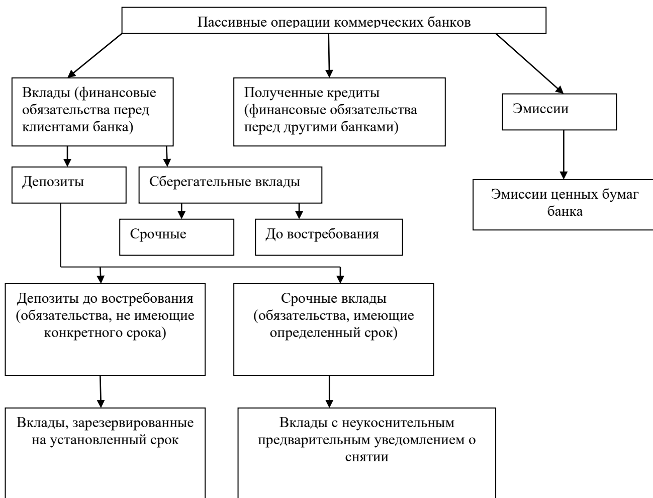
Рисунок 1 – Классификация пассивных операций коммерческого банка

Иллюстрации должны иметь наименование и, если необходимо, пояснительные данные (подрисуночный текст). Слово «Рисунок», его номер и через тире наименование помещают после пояснительных данных и располагают в центре под рисунком без точки в конце (рис.1):