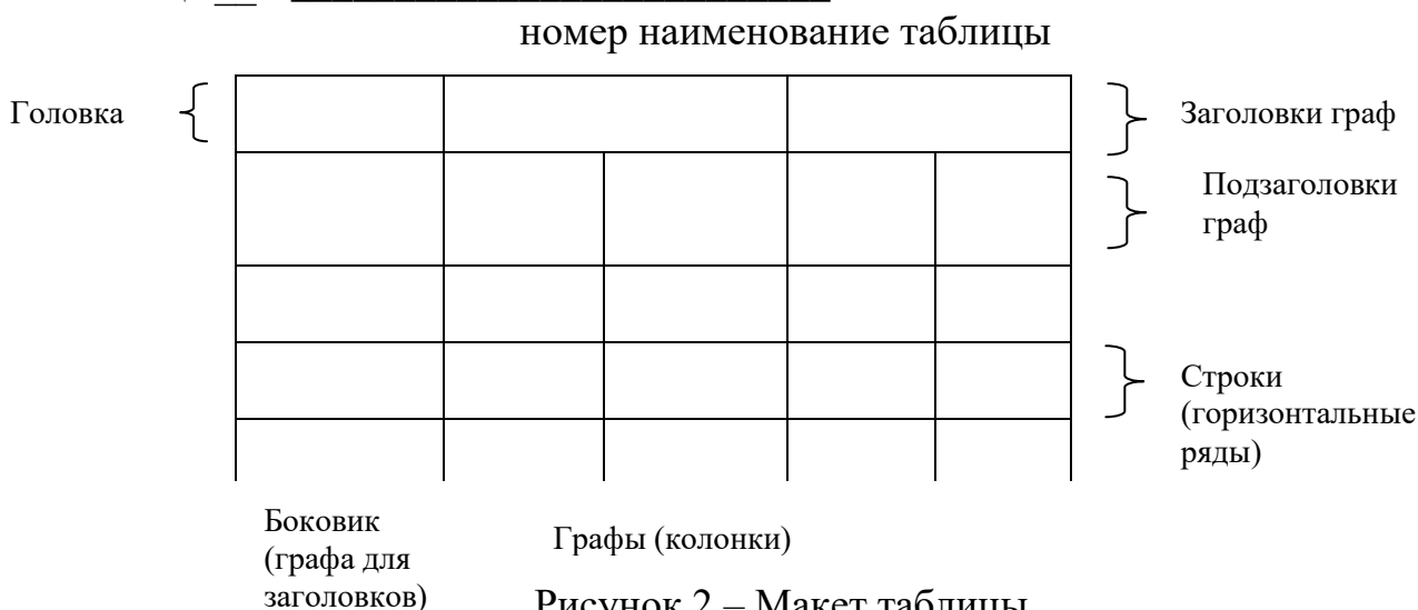
Рисунок 2 – Макет таблицы

Таблицы, за исключением таблиц приложений, следует нумеровать арабскими цифрами сквозной нумерацией.