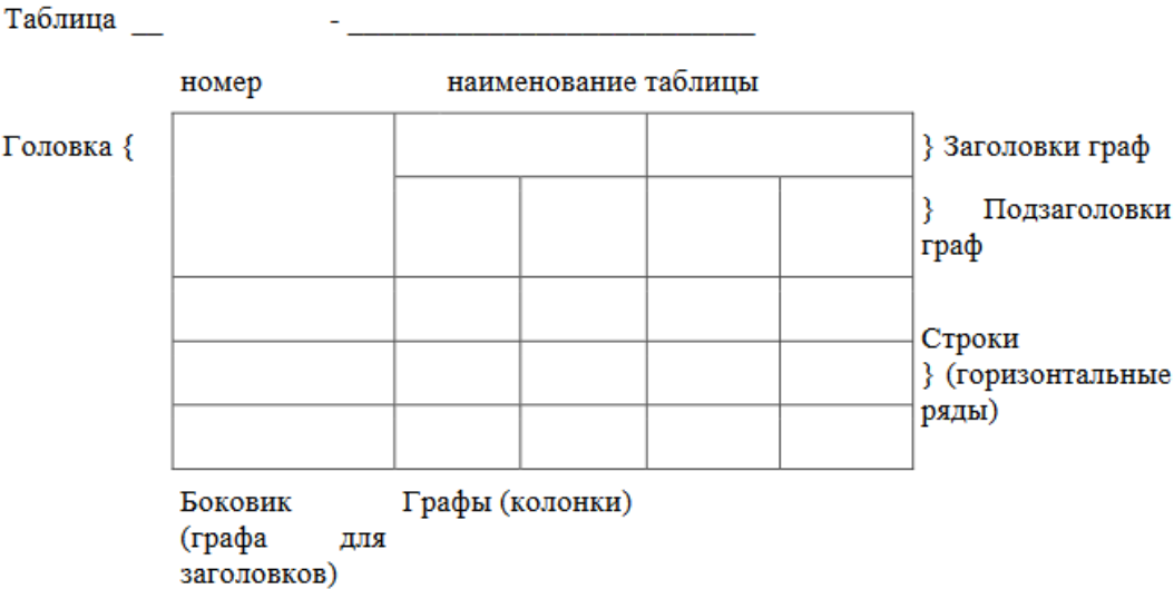
Рисунок 2 – Макет таблицы

После таблицы должно быть оставлено не менее одной свободной строки.