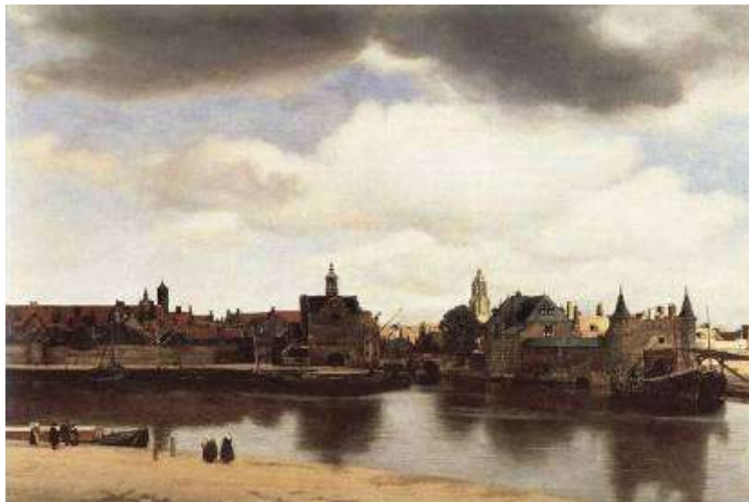
1. «Вид Дельфта». Вермеер Дельфтский