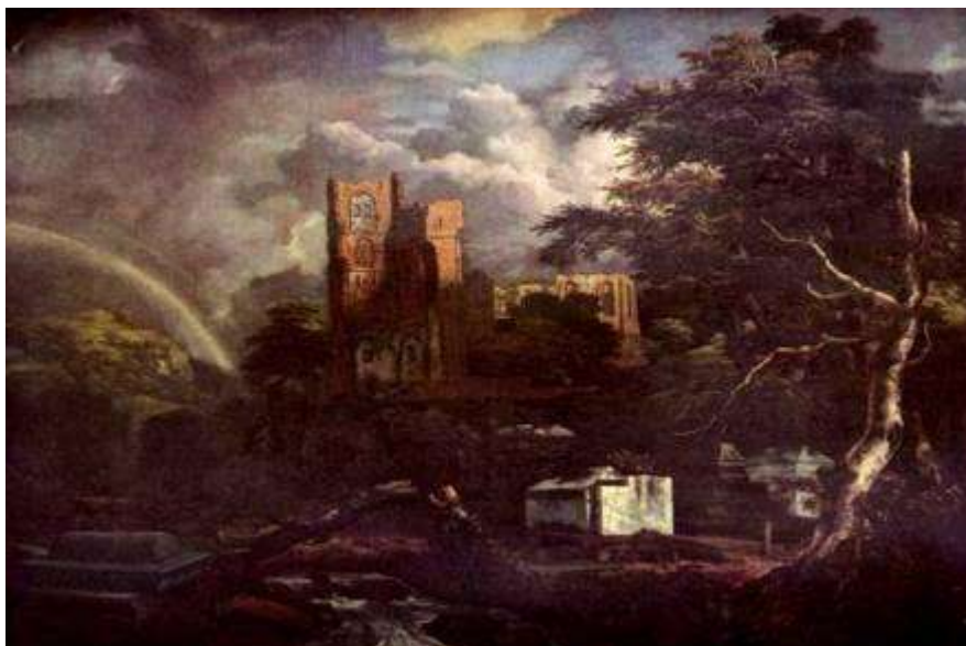
2. «Еврейское кладбище». Якоб Рейсдал