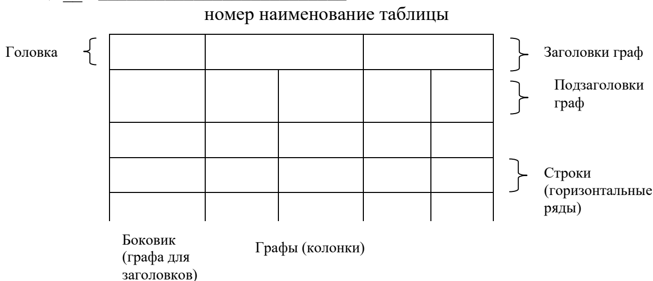
Рисунок 2 – Макет таблицы

Таблицы, за исключением таблиц приложений, следует нумеровать арабскими цифрами сквозной нумерацией.