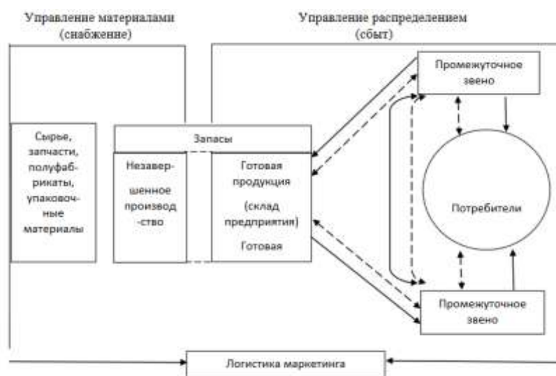
Рисунок 1 – Принципы логистической системы Рисунок 1 – Пример оформления рисунка

Иллюстрации должны иметь наименование и, если необходимо, пояснительные данные (подрисовочный текст). Слово «Рисунок», его номер и через тире наименование помещают после пояснительных данных и располагают в центре под рисунком без точки в конце (рис.1).