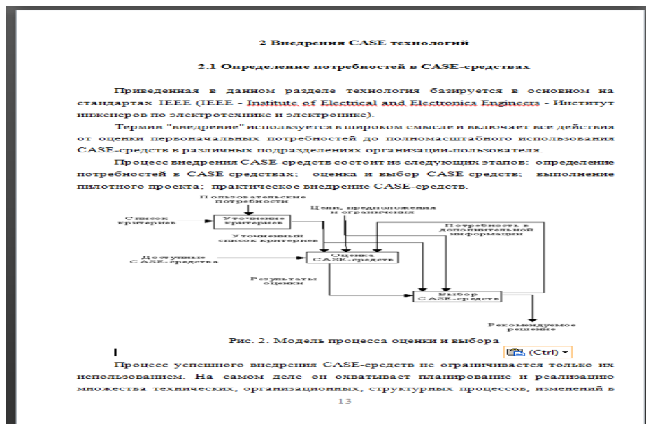
Рисунок 3. - Основная часть реферата.

Что нужно писать в заключении. Первым делом Вы как можно больше делаете собственных выводов по изученной теме и четко ответьте на поставленные вопросы в работе. Важно не отойти от темы и подводя итоги, сделайте обзор выберите ту точку зрения которая, по-вашему, наиболее подходит к данной теме работы. Все выводы у вяжите с целью и задачами, написанными во введении реферата. Объем заключения должен быть равен объему введения или быть чуть больше.