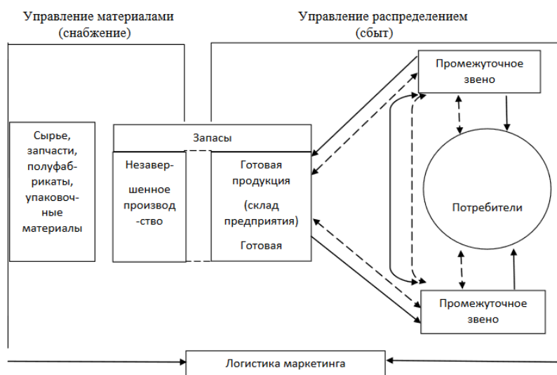
Рисунок 1 – Принципы логистической системы Рисунок 1 – Пример оформления рисунка

через тире наименование помещают после пояснительных данных и располагают в центре под рисунком без точки в конце (рис.1).