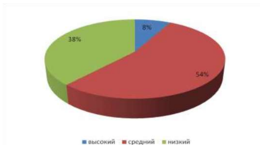
Рисунок 3 – Уровни сформированности лексических умений младших школьников по методике «Что такое? Что значит слово...?», автор Ф.Г. Даскалова Рисунок 1 – Пример оформления рисунка

Иллюстрации каждого приложения обозначают отдельной нумерацией арабскими цифрами с добавлением перед цифрой обозначение приложения. Например, Рисунок А.3