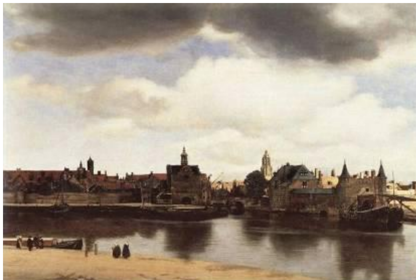
1. «Вид Дельфта». Вермеер Дельфтский