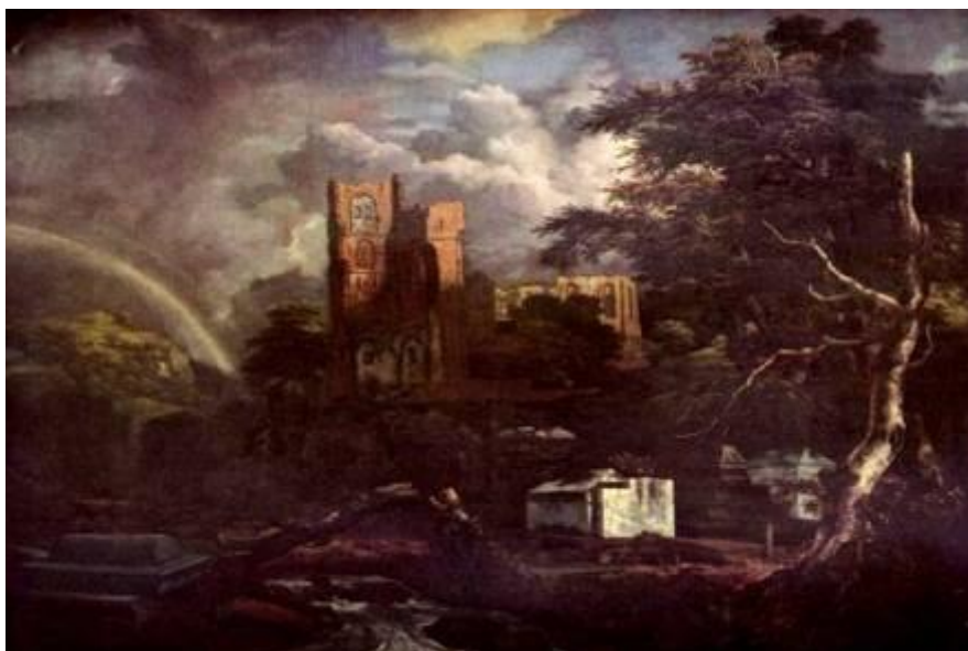
2. «Еврейское кладбище». Якоб Рейсдал