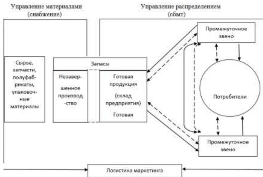
Рисунок 1 – Принципы логистической системы Рисунок 1 – Пример оформления рисунка

Если наименование рисунка состоит из нескольких строк, то его следует записывать через один межстрочный интервал. Наименование рисунка приводят с прописной буквы. Перенос слов в наименовании графического материала не допускается.