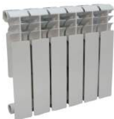
Радиатор биметаллический «СТК» 350x80