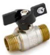
Кран шаровой, ручка-бабочка (ш/ш)