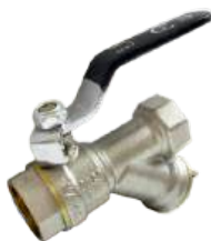
Кран шаровой с фильтром, ручка-рычаг