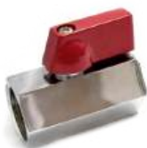
Миникран г/г (750)