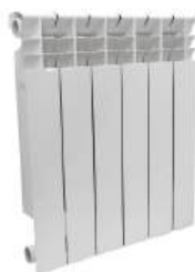
Радиатор биметаллический «SunBath» 500x80