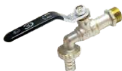
Кран шаровой с носиком, ручка-рычаг