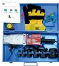
Комплект сварочного оборудования «СТК» PP-R (Ф20-63) MQ-R002