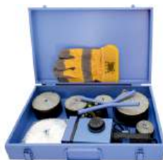
Комплект сварочного оборудования «СТК» PP-R (Ф50-110) 110-GI