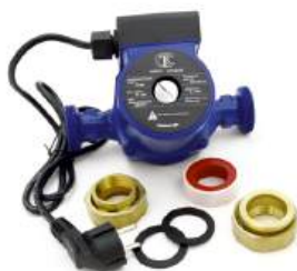
Насос циркуляционный «СТК»