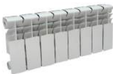
Радиатор алюминиевый «СТК» 200x80