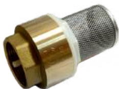
Обратный клапан с фильтром «СТК»

В качестве материала для производства фильтров и обратных клапанов используется латунь.