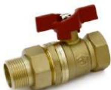
Кран шаровой 11Б27п1 (170), ручка-бабочка с накидной гайкой (американка)