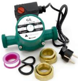
Насос циркуляционный «GLORIOSO» (с гайками)