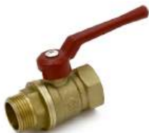
Кран шаровой 11Б27п1 (130), ручка-рычаг (г/ш)