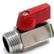
Миникран г/ш (750)