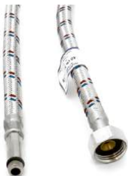
Подводка к смесителю «СТК» (латунная гайка)