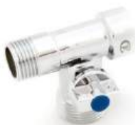
Кран 3-х проходной вентильный г/ш/ш (660)