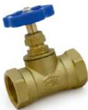
Вентиль для воды 15Б3р