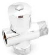
Кран 3-х проходной вентильный (661)

Краны «СТК» производятся на современном европейском оборудовании с соблюдением всех необходимых норм. Корпус кранов изготовлен из латуни. Краны применяются в качестве запорного устройства при подключении бытовых и сантехнических приборов к системе горячего и холодного водоснабжения.