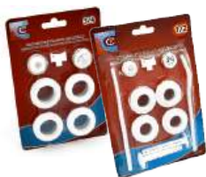
Комплект для радиатора (кронштейны/без кронштейна)

В ассортименте компании «Сантрек» есть все необходимые комплектующие торговой марки «СТК» для подключения отопительных радиаторов.