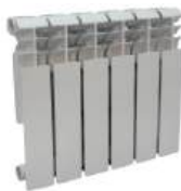
Радиатор алюминиевый «СТК» 350x80