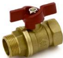
Кран шаровой 11Б27п1 (140), ручка-бабочка (г/ш)