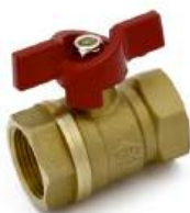
Кран шаровой 11Б27п1 (120), ручка-бабочка (г/г)