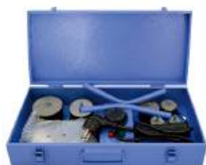
Комплект сварочного оборудования «СТК» PP-R (Ф20-63) MQ-R010 без ножниц для трубы