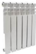
Радиатор алюминиевый «Diablo» 500x80