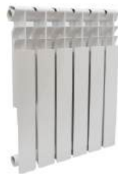
Радиатор биметаллический «Diablo» 500x80