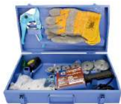
Комплект сварочного оборудования «СТК» PP-R (Ф20-63) MQ-R003