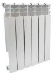
Радиатор биметаллический «GLORIOSO» 500x80