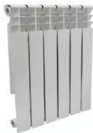
Радиатор биметаллический «СТК» 500x80