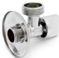
Кран угловой (ш/ш + отражатель)