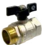
Кран шаровой ручка-бабочка (г/ш)