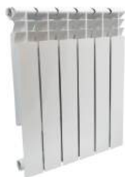
Радиатор алюминиевый «GLORIOSO» 500x80