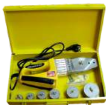
Комплект сварочного оборудования «СТК» PP-R (Ф20-63) MQ-R020