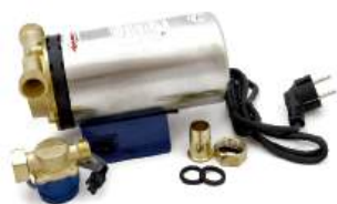
Насос для повышения давления «СТК»