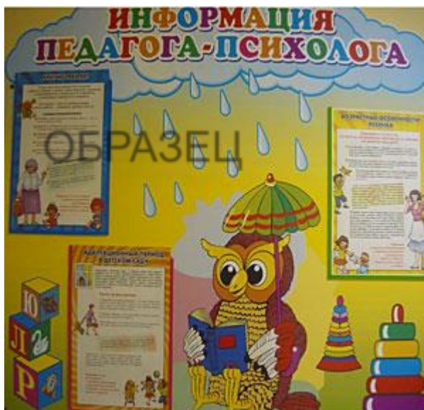
Рис. 8 Зона ожидания приема

Зону ожидания приема лучше организовать в пространстве перед кабинетом психолога, с учетом того, что она не должна находиться в районе активного передвижения людей.