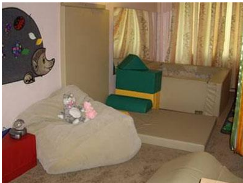
Рис. 6 Зона релаксации и снятия эмоционального напряжения