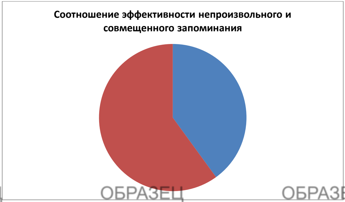
Рис. 12 Соотношение эффективности произвольного и совмещенного запоминания

У обучающихся произвольное запоминание изучалось у 24 человек, а совмещенное у 16 человек.