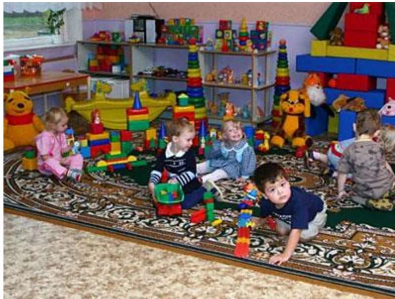
Рис. 5 Зона игровой терапии

Зона релаксации и снятия эмоционального напряжения.