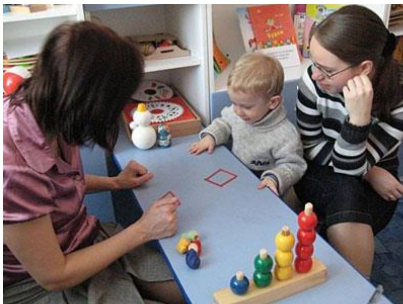
Рис. 3 Зона диагностической работы