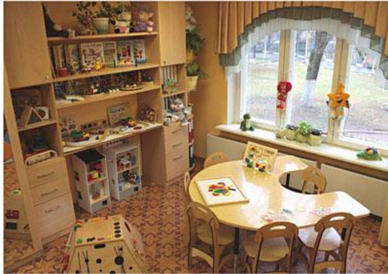
Рис. 4 Зона коррекционно-развивающей работы