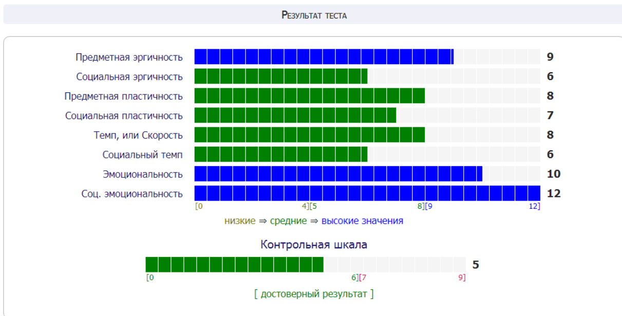
Рис. 10 Результаты испытуемого 1 Темперамент: холерик. Предметная эргичность: