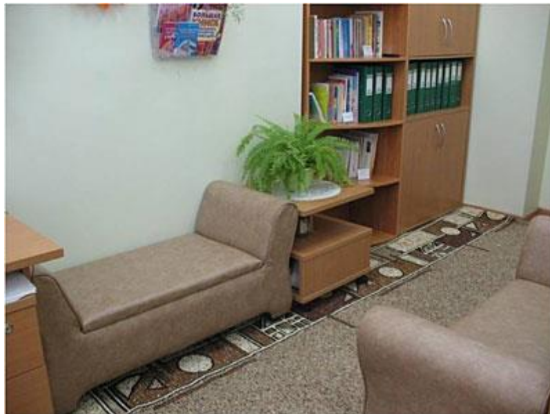
Рис. 1 Зона первичного приёма