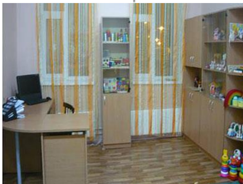
Рис. 7 Личная (рабочая) зона психолога

В кабинете обязательно должна быть предусмотрена личная зона психолога, необходимая ему для подготовки к работе (занятиям, консультациям и пр.), обработки данных, хранения материалов обследования, рабочей документации, методической литературы, пособий и пр.