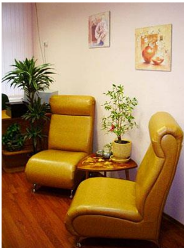
Рис. 2 Зона консультативной работы