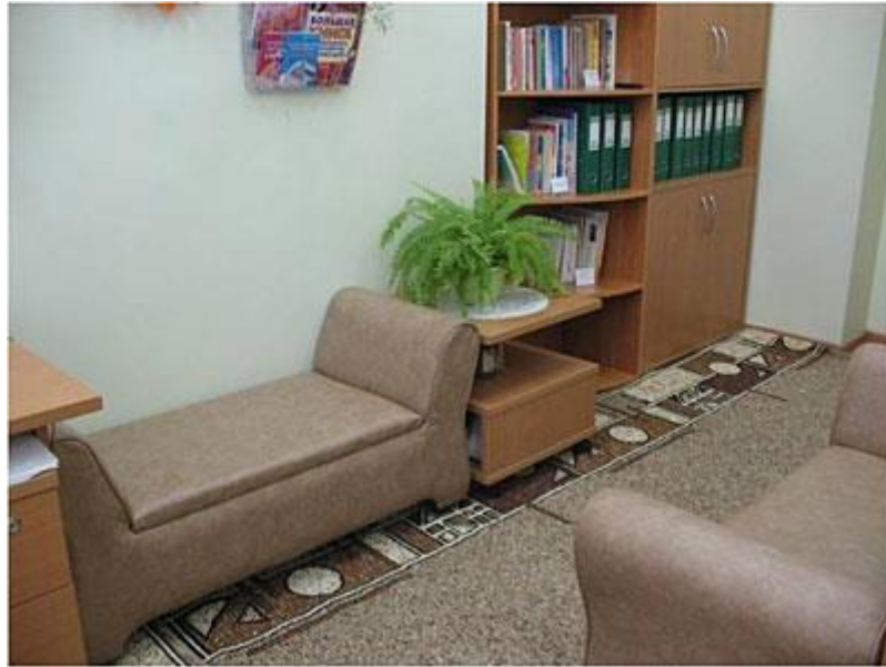
Рис. 1 Зона первичного приёма