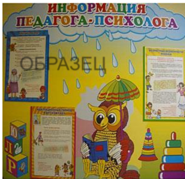
Рис. 8 Зона ожидания приема

Зону ожидания приема лучше организовать в пространстве перед кабинетом психолога, с учетом того, что она не должна находиться в районе активного передвижения людей.