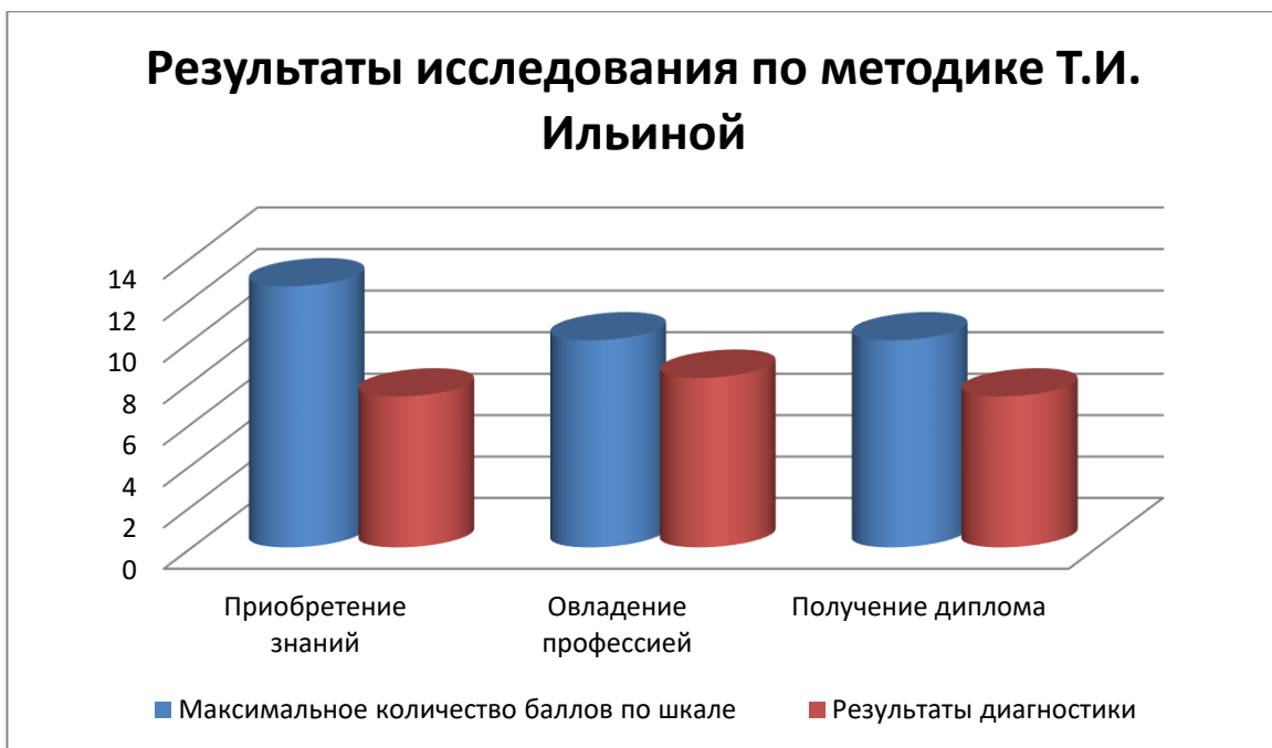
Рис. 9 Результаты исследования по методике Т.И. Ильиной

Среднее значение по всем шкалам ниже максимума.