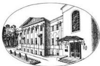
Литературный институт 1933

Молодёжный научно-практический форум проводится при поддержке Гётевской комиссии при научном совете РАН «История мировой культуры», лаборатории сравнительного литературоведения и креативных практик Московского государственного лингвистического университета, кафедры перевода Литературного института им. А. М. Горького, Высшей школы сценических искусств и при информационной поддержке «Литературной газеты».