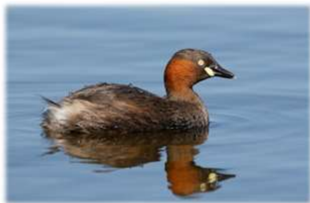
Малая поганка (Tachybaptus ruficollis)

Чомга обитает в Европе, Азии и Африке, предпочитая районы с умеренным климатом. В Африке чомгу можно встретить на юге континента, к югу от Сахары. Также она обитает в Австралии и Новой Зеландии.