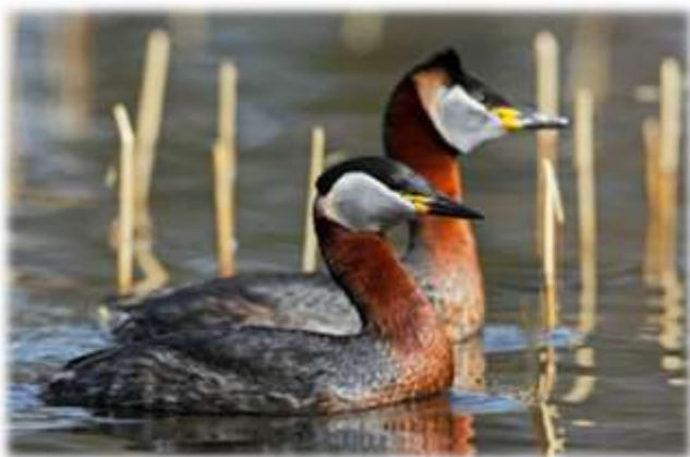
Серощёкая поганка (Podiceps grisegena)

Чомга не единственная представительница в отряде Поганкообразных, но самая многочисленная. Всего семейство насчитывается более 15 видов. В России встречаются пять: чомга, или большая поганка, серощёкая поганка, красношейная поганка, черношейная поганка и малая поганка.