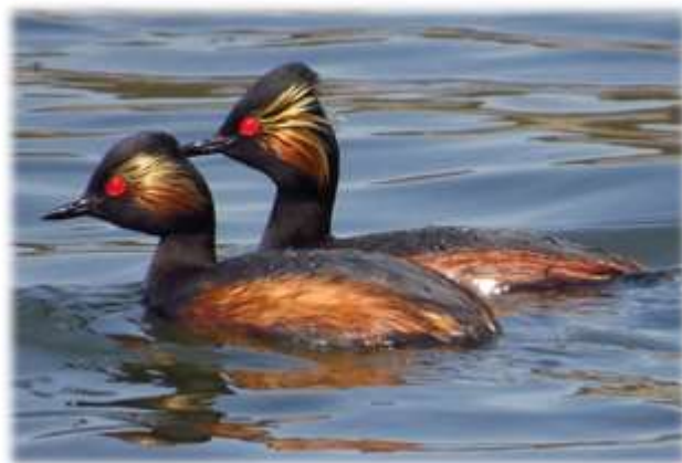
Черношейная поганка (Podiceps nigricollis)