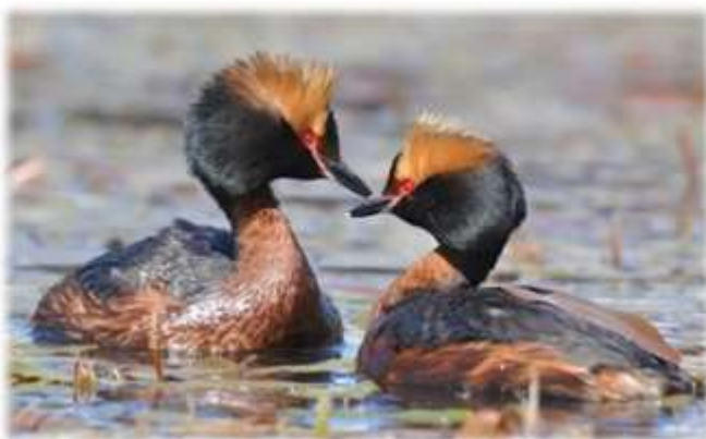
Красношейная поганка (Podiceps auritus)