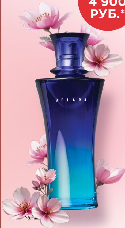
Парфюмерная вода Belara®