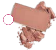
РОБКИЙ РУМЯНЕЦ (Shy Blush) 10197863