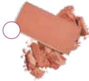
СПЕЛЫЙ ПЕРСИК (Juicy Peach) 10197864

Румяна Mary Kay ChromaFusion®, 4,8 г 990 РУБ.