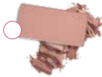
РОЗОВЫЙ ОТБЛЕСК (Hint of Pink) 10197865