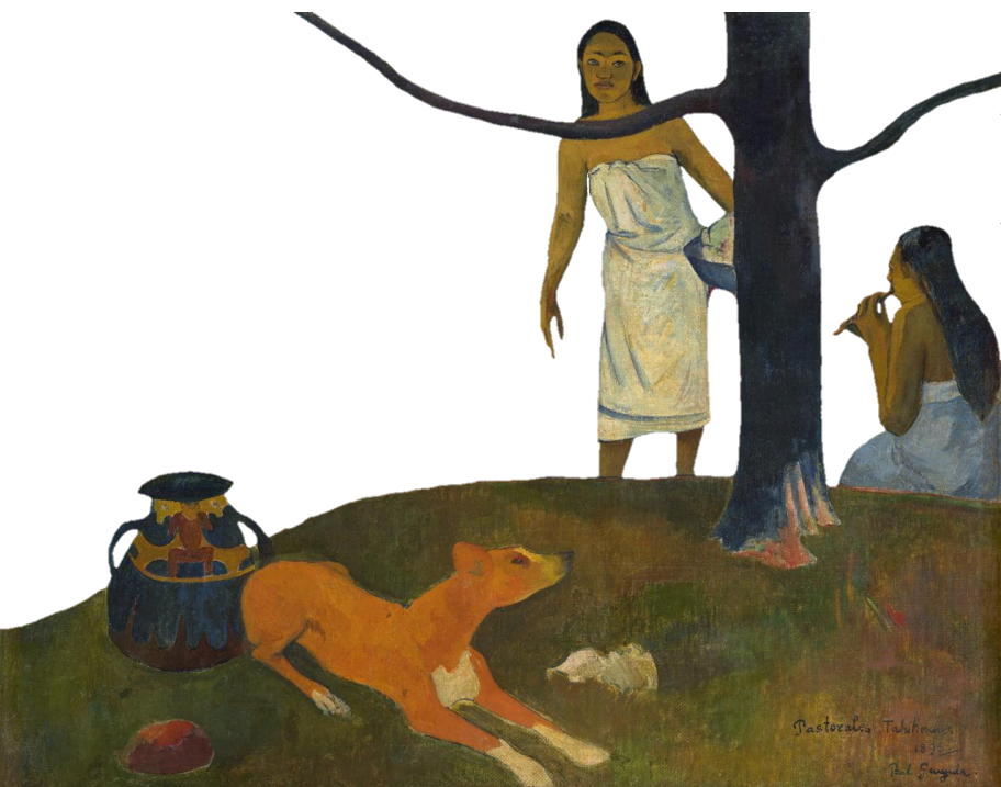
Pastoralis Tahitiensis 1892 Paul Gauguin