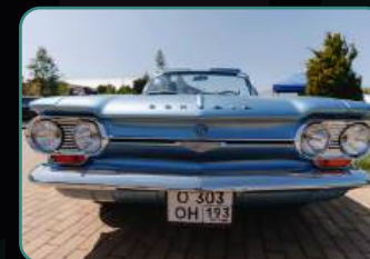
Официальный фотоотчет.