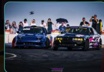
Официальный фотоотчет.