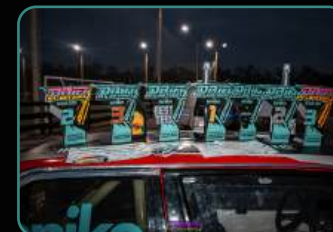
Официальный фотоотчет.