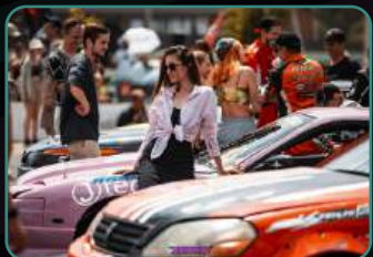
Официальный фотоотчет.