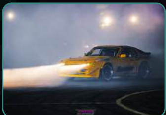
Официальный фотоотчет.