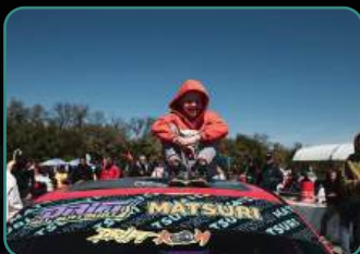
Официальный фотоотчет.