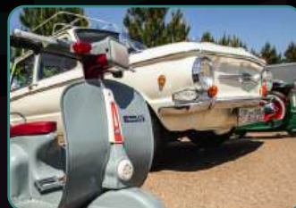
Официальный фотоотчет.