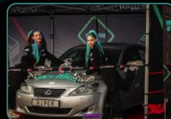
Официальный фотоотчет.