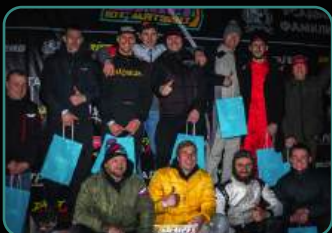
Официальный фотоотчет.