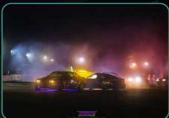
Официальный фотоотчет.