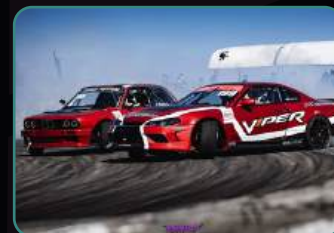
Официальный фотоотчет.