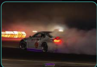
Официальный фотоотчет.