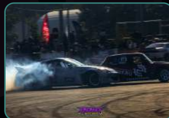
Официальный фотоотчет.