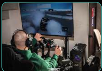
Официальный фотоотчет.