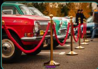
Официальный фотоотчет.