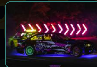
Официальный фотоотчет.