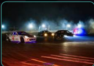
Официальный фотоотчет.