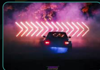
Официальный фотоотчет.