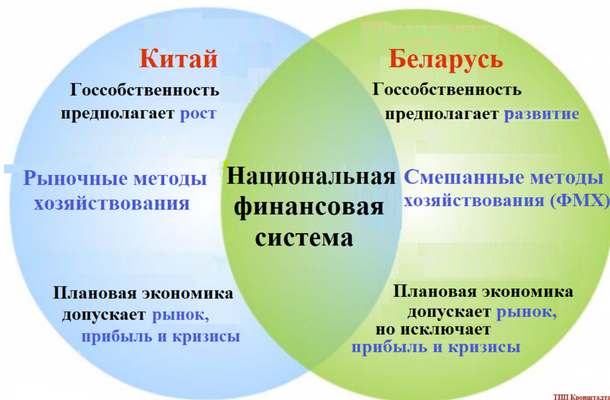
Рис.1 Сравнение модели экономического настоящего КНР с моделью экономического будущего Республики Беларусь

Модель экономического будущего РБ, как показано на рис.1, наиболее близка не российской сырьевой колониальной модели экономики, а действующей социально-направленной, но покамест инфляционной, китайской экономической модели, учитывая опыт реализации которой можно перейти к осуществлению новой белорусской неинфляционной социально-направленной модели экономики, чему способствует активно развивающееся сотрудничество Республики Беларусь с Китайской народной республикой (КНР) в рамках сопряжения долгосрочных стратегий двух стран.